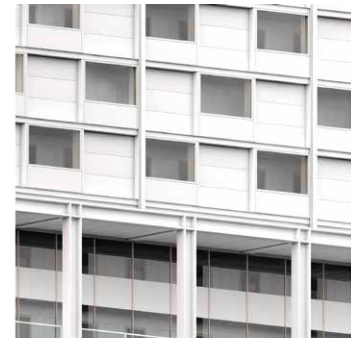
Détail de façade sur le boulevard périphérique