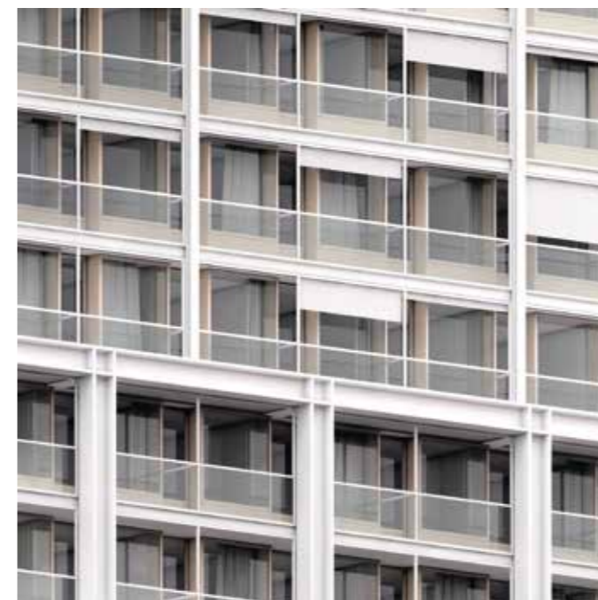
Détail de la façade sur rue